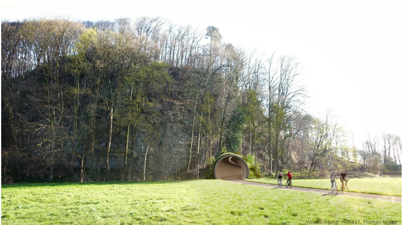
Visualisierung: HOF437, Thomas Knapf